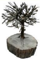
Flor de Plata de Túniz 1995