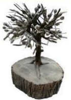
Flor de Plata de Túnez 1995