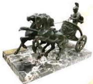
Biga de Roma 1996