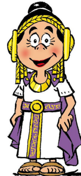
Photo-Call de Fiestas. Bolos infantiles. Aprende y practica Ajedrez. Colabora: Club Ajedrizate. Exhibición de tiro con arco. Club de Tiro con Arco de CT. Llévate tu chapa con Icue y Rascasote. Colabora PROLAM. Actividades de animación dirigidas a niños. Colabora Nosomosmonstruos.

10:00h Taller de pesca deportiva Puerto, cola de ballena. (Fed. de Pesca Dep. R.M.) 10:00h Taller de arqueología. Pequeños arqueólogos. Plaza de San Francisco. 11:00h Actividades Plaza de San Francisco